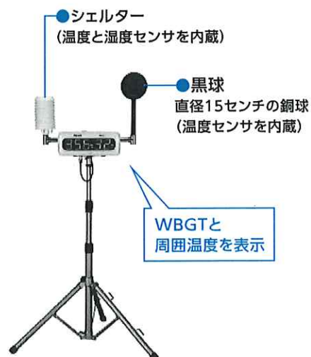
図2 WBGT測定装置 (リアルタイムでWBGTと周囲温度が表示される)